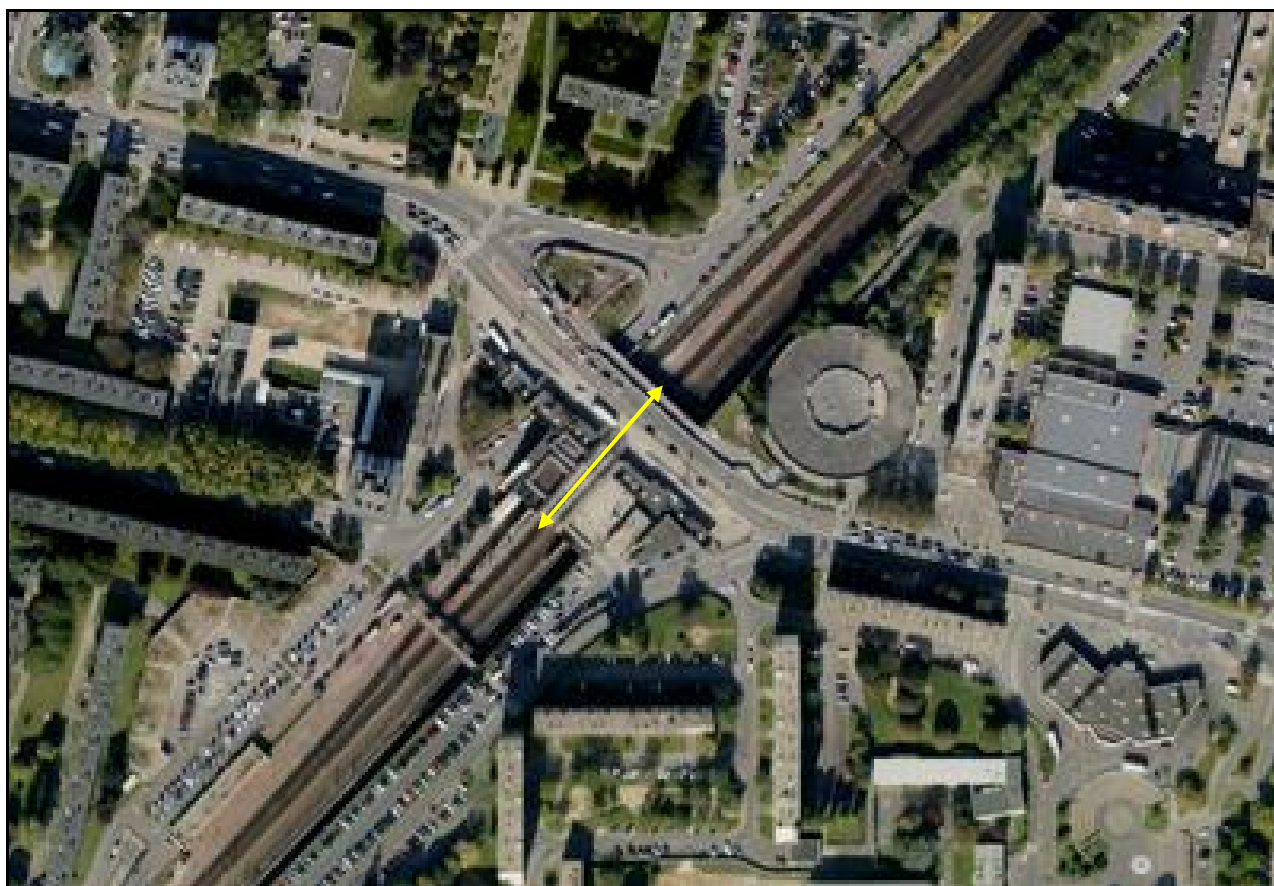
Vue aérienne de la gare souterraine de Garges les Gonesse

Si cette fiche comporte des erreurs ou des oublis, merci de nous le signaler.