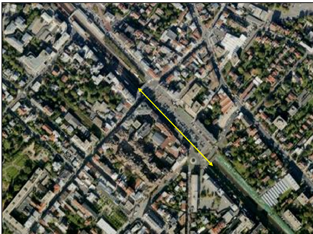
Vue aérienne du faux tunnel d'Enghien les Bains

Si cette fiche comporte des erreurs ou des oublis, merci de nous le signaler.