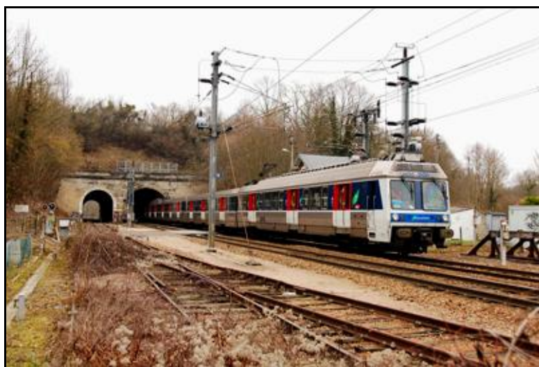
L'entrée du tunnel alors qu'un train passe dans le souterrain Est