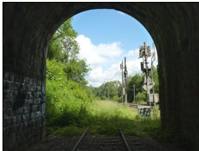
L'entrée et la sortie vues de l'intérieur