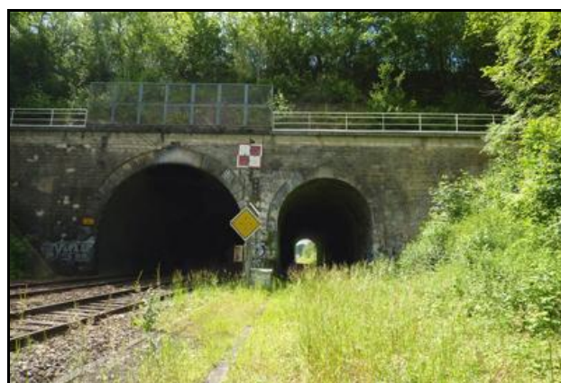
Le tunnel Ouest est ici à droite