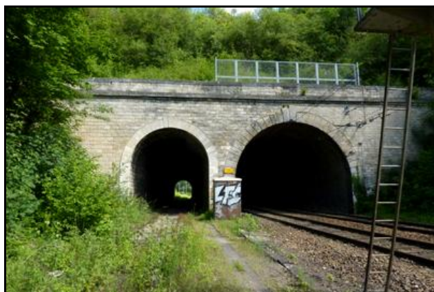
Le tunnel Ouest est ici à gauche