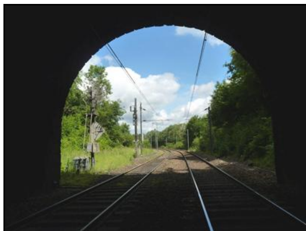
L'entrée et la sortie du tunnel vues de l'intérieur