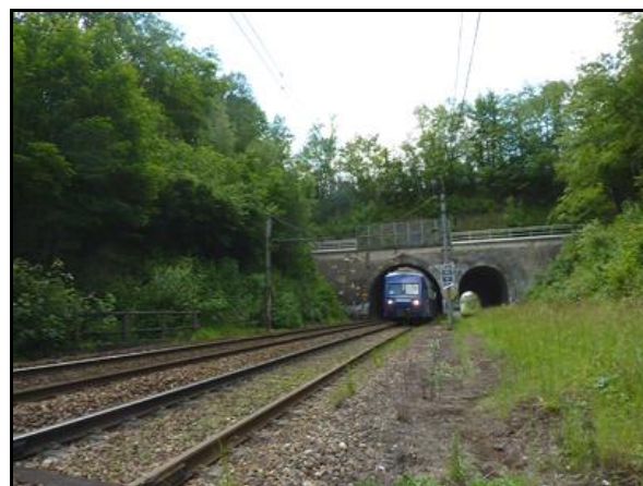
Ci-dessus et ci-dessous, diverses circulations ferroviaires