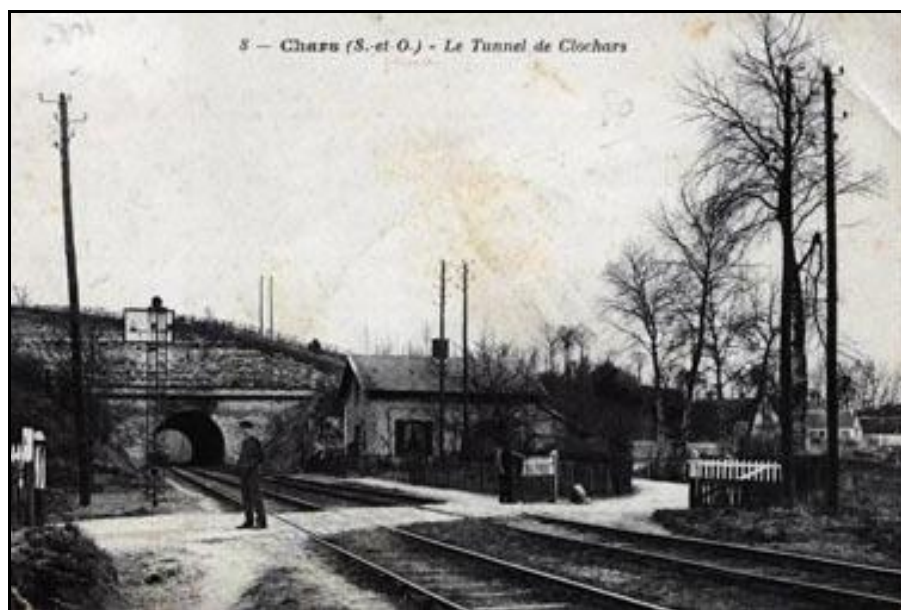
Vieille carte postale montrant l'entrée du tunnel de Chars du temps où il était encore unique

Si cette fiche comporte des erreurs ou des oublis, merci de nous le signaler.