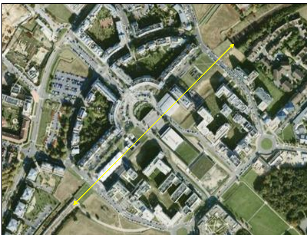
Vue aérienne de la galerie de Cergy le Haut

Si cette fiche comporte des erreurs ou des oublis, merci de nous le signaler.