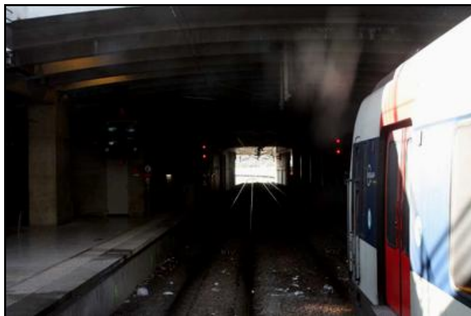
Deux vues de la gare de Cergy le Haut. A droite, en regardant la galerie vers la sortie