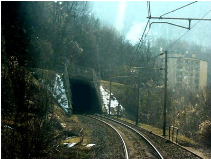
Le pont-route qui masque l'entrée du tunnel