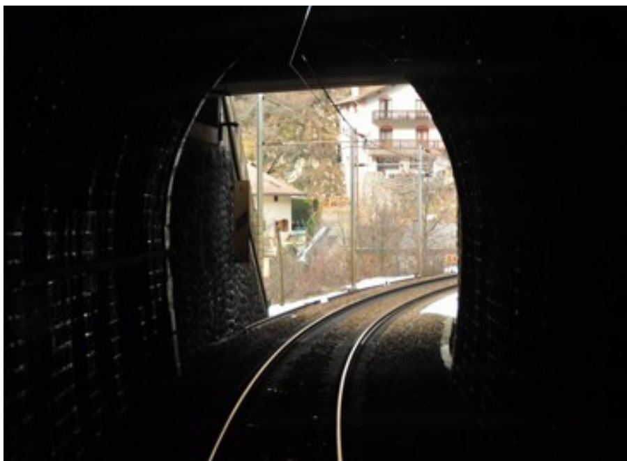
Depuis l'intérieur, on distingue bien le tablier du pont qui prolonge le tunnel.