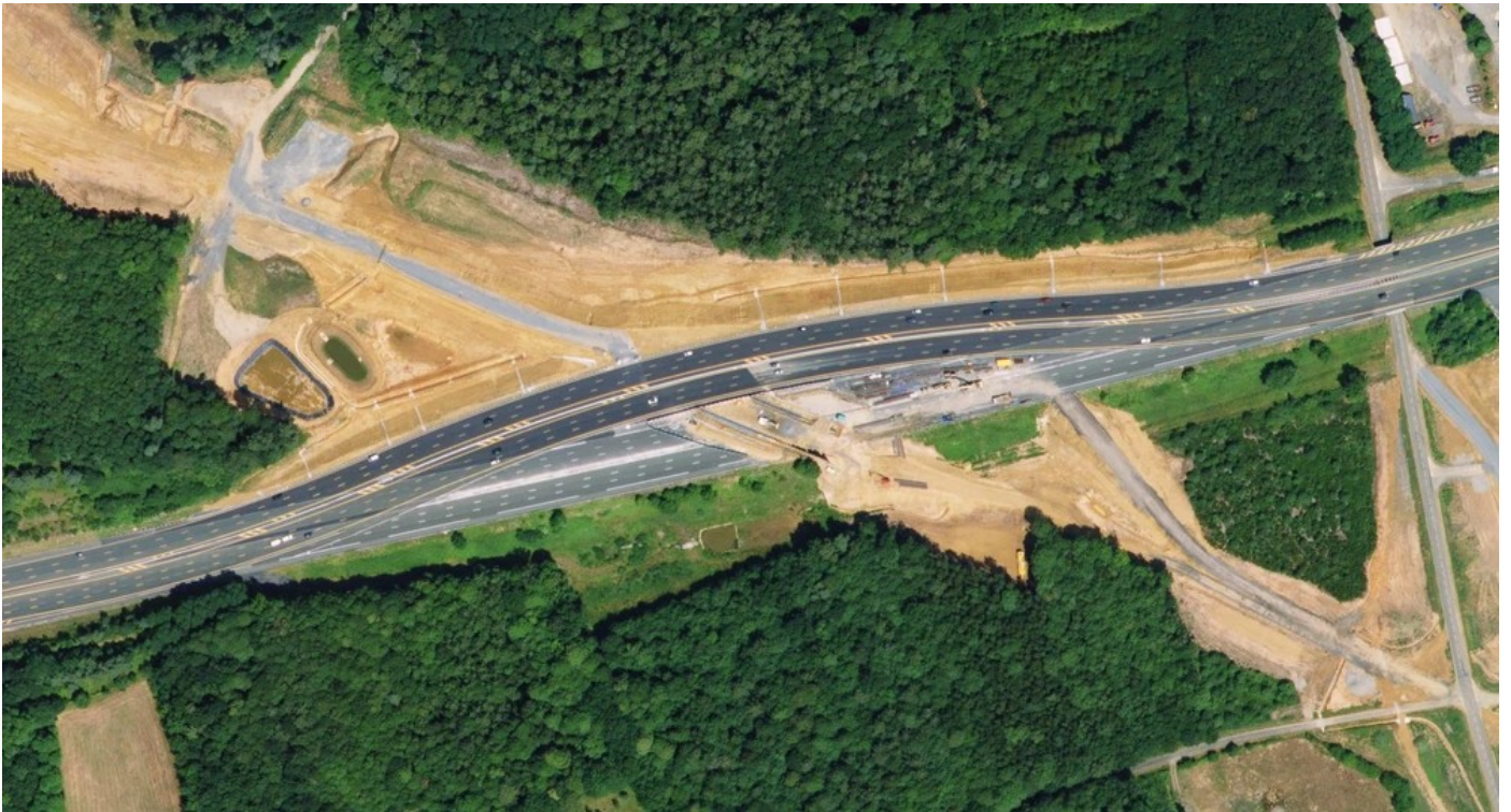
Vue aérienne de la tranchée couverte lors de sa construction en 2013

Cette tranchée couverte livre le passage à l'autoroute A11. Pour permettre sa construction, l'A11 a été déviée provisoirement dans les deux sens au Nord du futur ouvrage.