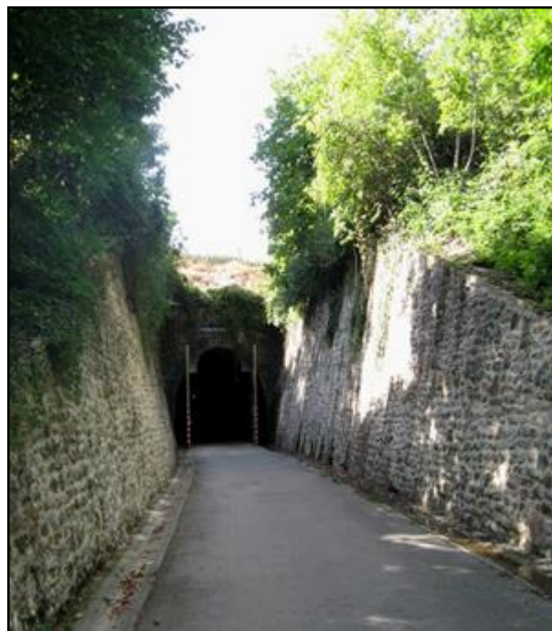
La Voie Verte de randonnée aménagée dans le tunnel alors que celui-ci possède encore ses anciennes portes de fermeture