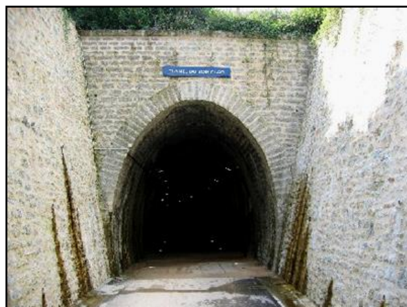
Le tunnel aujourd'hui