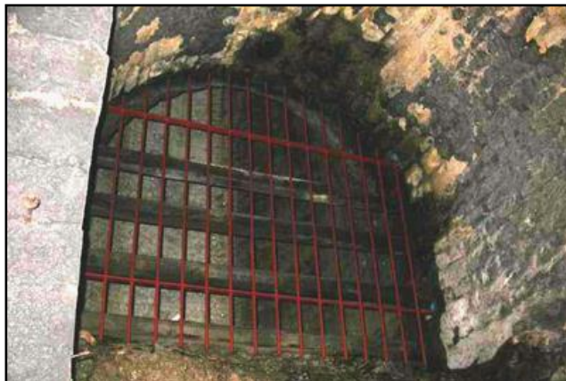
L'ouverture discrète de la cheminée centrale d'aération de 86 m de profondeur et son débouché dans l'un des pénétrons du tunnel