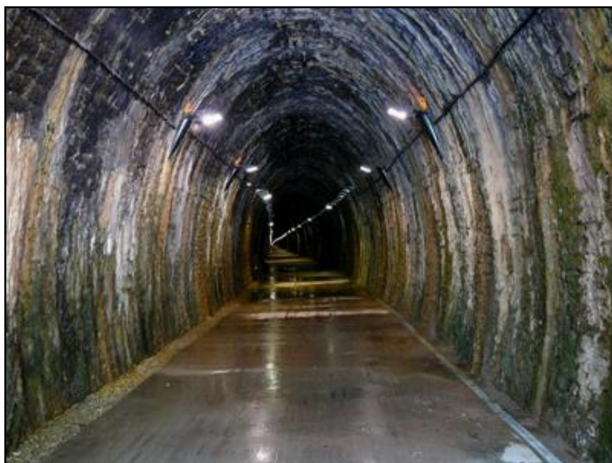
Ci-dessus et ci-dessous, la galerie éclairée pour les besoins de la randonnée