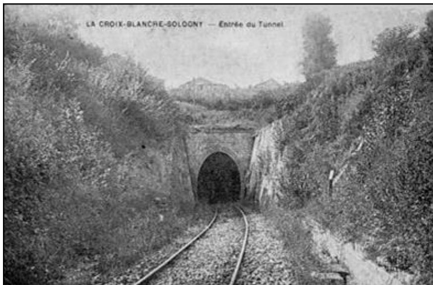
La sortie du tunnel du temps où la ligne était encore en service

Si cette fiche comporte des erreurs ou des oublis, merci de nous le signaler.