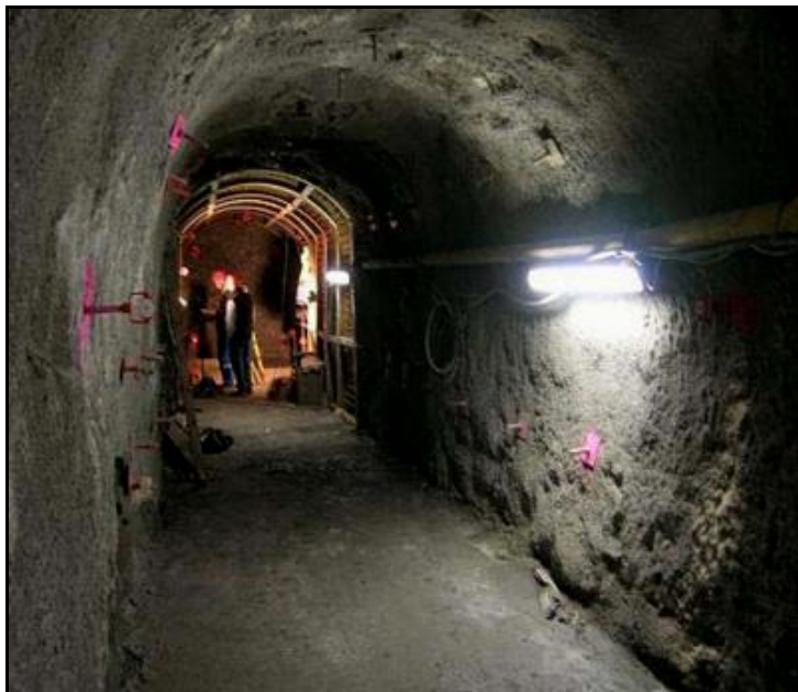
Vue intérieure de la petite galerie de reconnaissance préalable

A noter que les travaux préparatoires à cet ouvrage ont exigé le creusement d'un puits de 24 m de profondeur et la réalisation d'une petite galerie horizontale de 20 m de long, parallèle au tracé actuel, pour réaliser divers essais d'étude de la tenue du terrain encaissant et des revêtements à adopter pour la galerie ferroviaire.