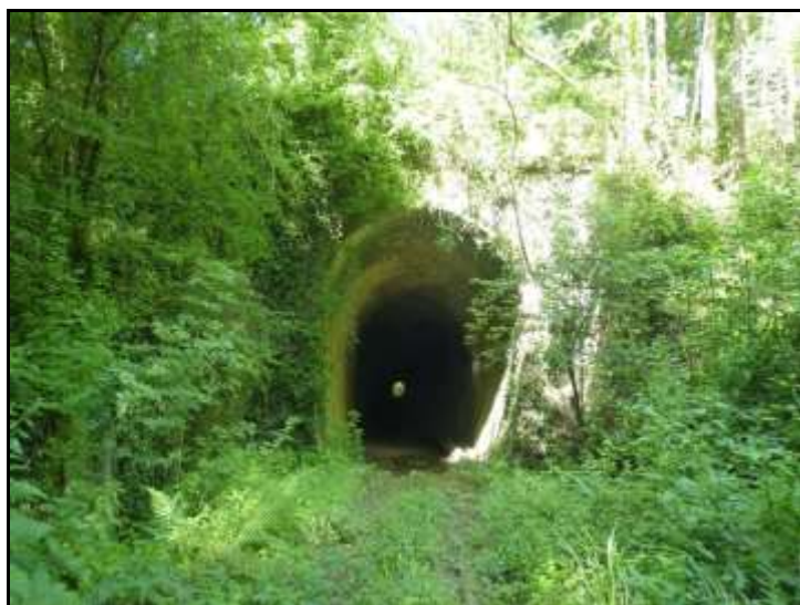
Prise de vue datant de juillet 2013