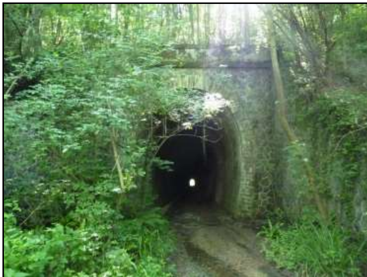
Prise de vue datant de juillet 2013

Si cette fiche comporte des erreurs ou des oublis, merci de nous le signaler.