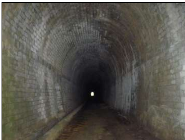
Prise de vue datant de juillet 2013