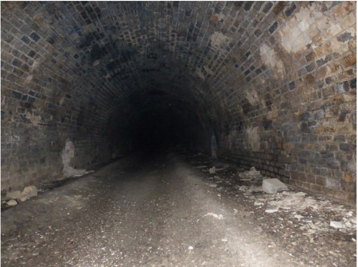
Vue en direction de l'entrée, depuis la sortie (01/05/2013)