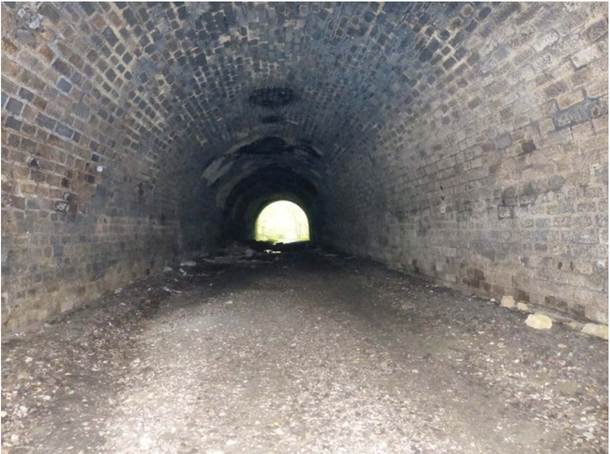
Vue vers la sortie (01/05/2013)