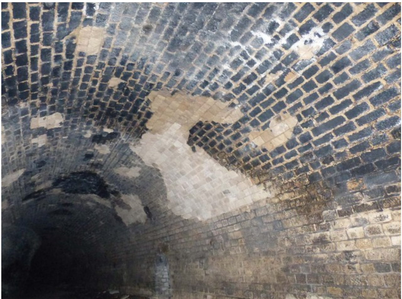
État de la voûte vers la sortie du tunnel (01/05/2013)