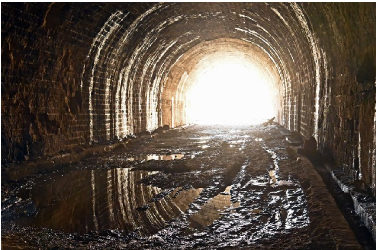
Vue vers l'entrée (20/03/2026)