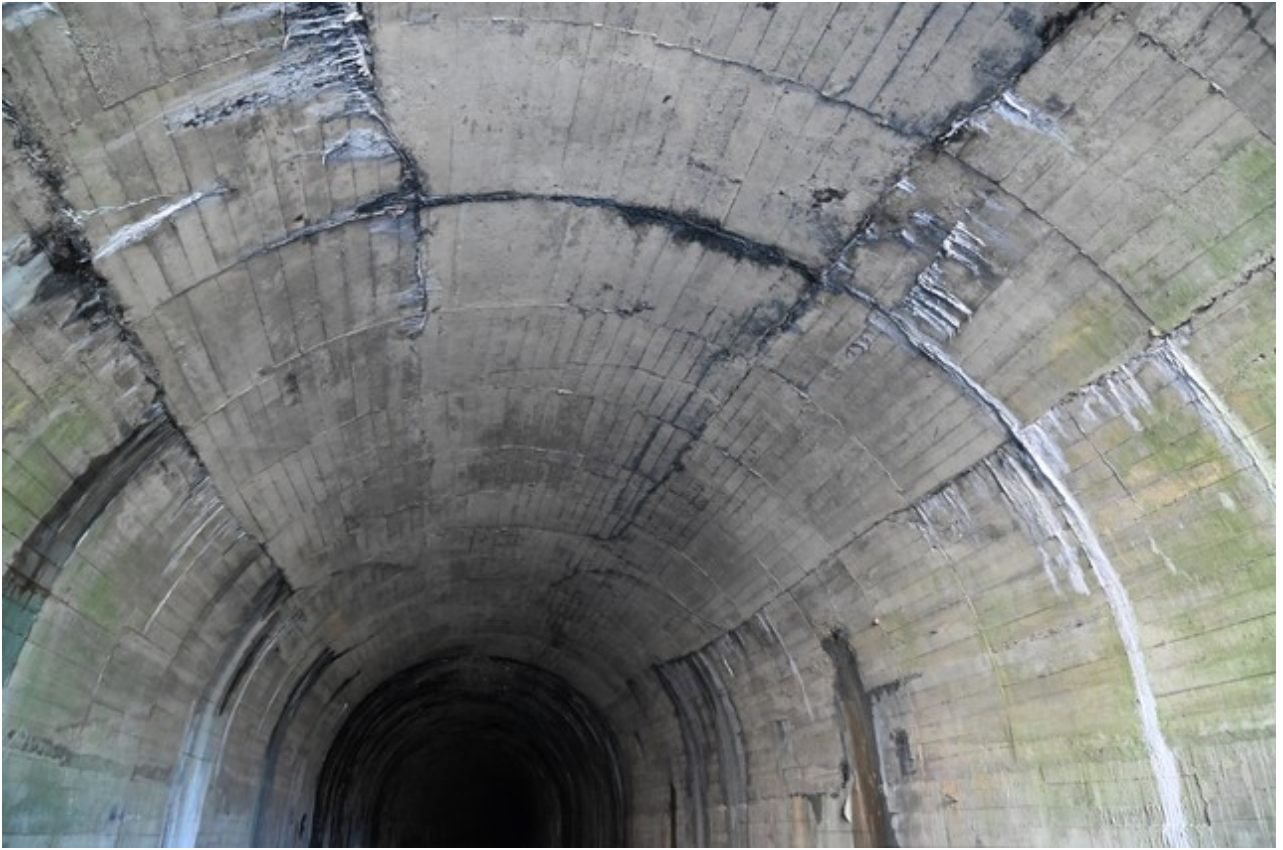
Revêtement bétonné du tunnel vers son entrée, traces possibles d'une réparation suite à une destruction par faits de guerre (20/03/2026)