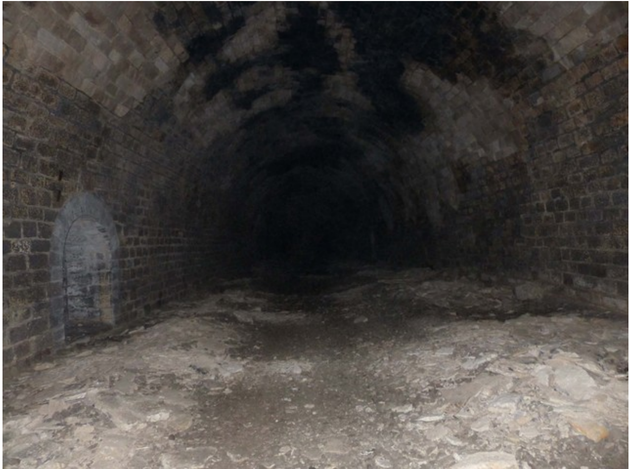
Vue au milieu du tunnel, avec les nombreux décollément de maçonneries (01/05/2013)