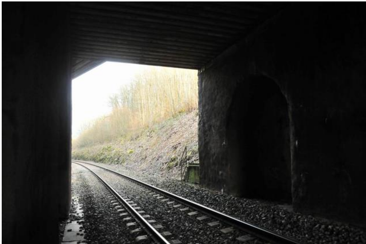
Vue vers la sortie