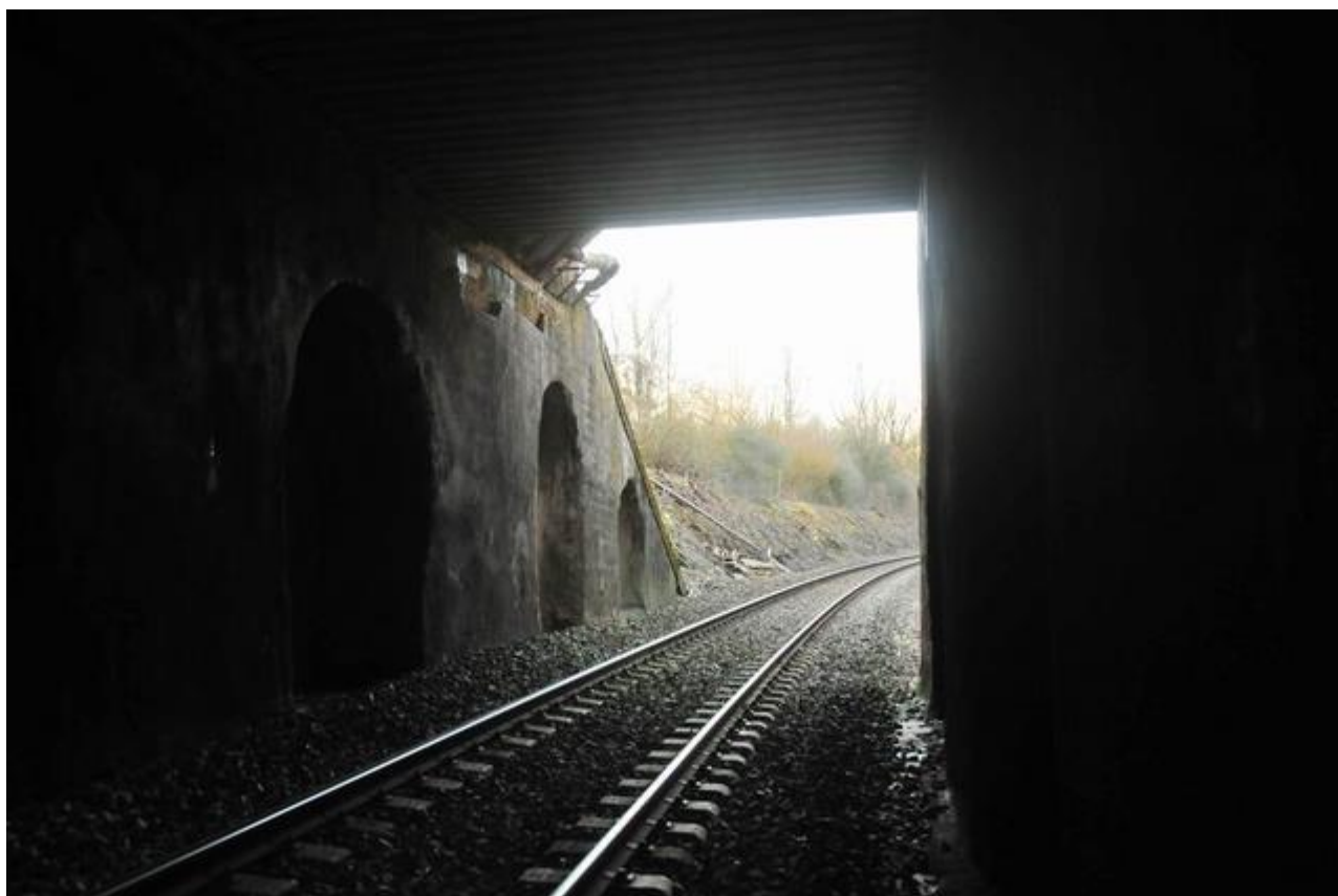
Vue vers l'entrée

Si cette fiche comporte des erreurs ou des oublis, merci de nous le signaler.