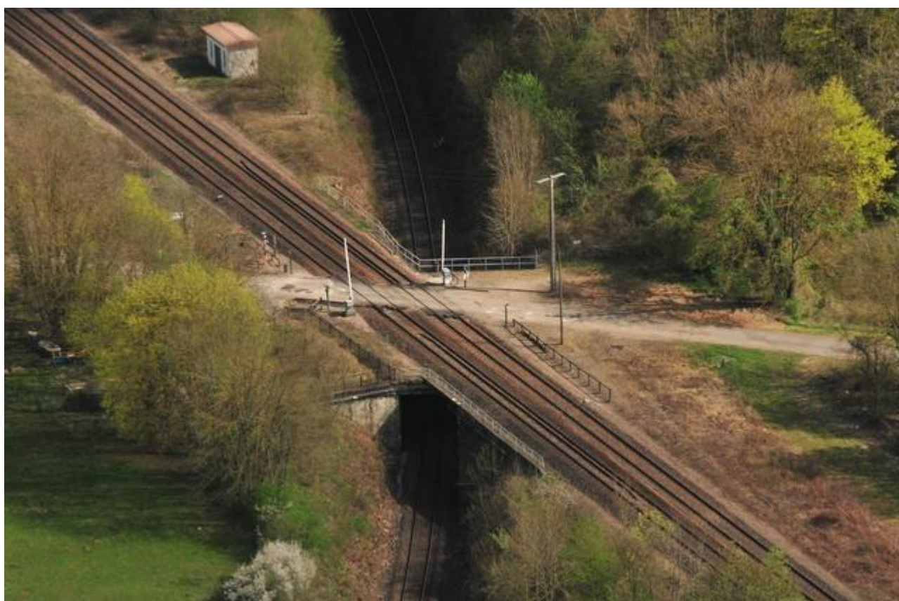
Vue aérienne de l'entrée de la galerie