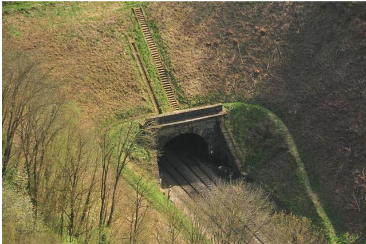
Vue aérienne de l'entrée

Si cette fiche comporte des erreurs ou des oublis, merci de nous le signaler.