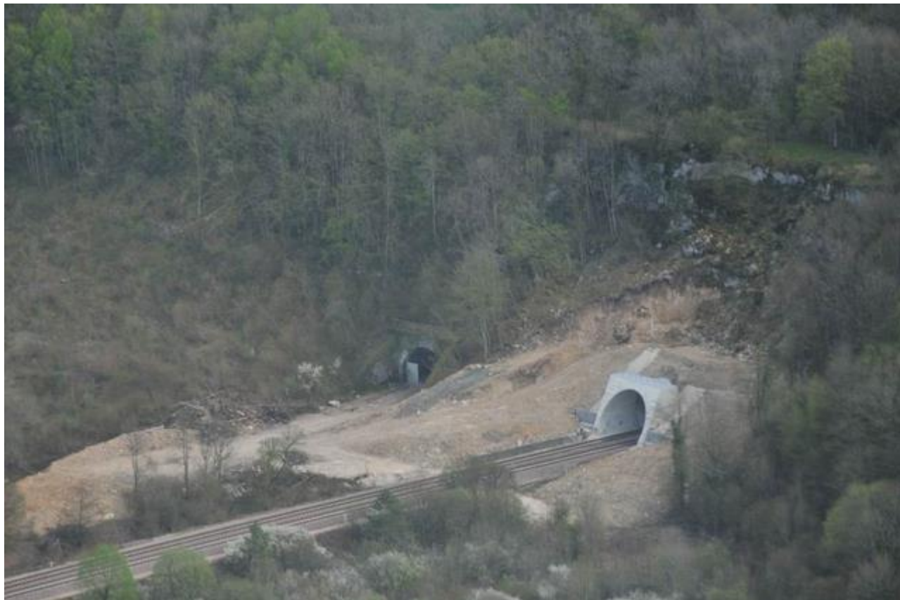
L'entrée du tunnel ainsi que celle de l'ancien tunnel des Lachères (52315.2)

Si cette fiche comporte des erreurs ou des oublis, merci de nous le signaler.