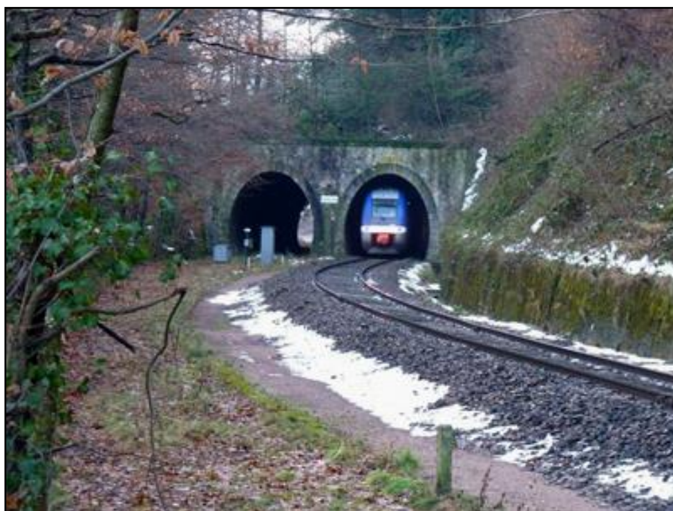
Un train venant du Puy en Velay arrive à Unieux dont la gare est après la galerie