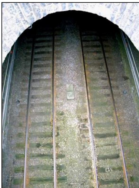
La sortie de la galerie

Si cette fiche comporte des erreurs ou des oublis, merci de nous le signaler.