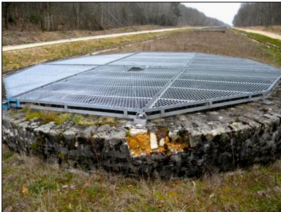
Gros plan sur le toit de la galerie et le débouché en surface d'une des 21 cheminées d'aération Une autre cheminée visible en arrière plan