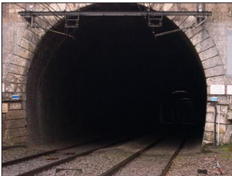
Sur cette belle photo de l'entrée, on devine les premières cheminées d'aération dans la voûte