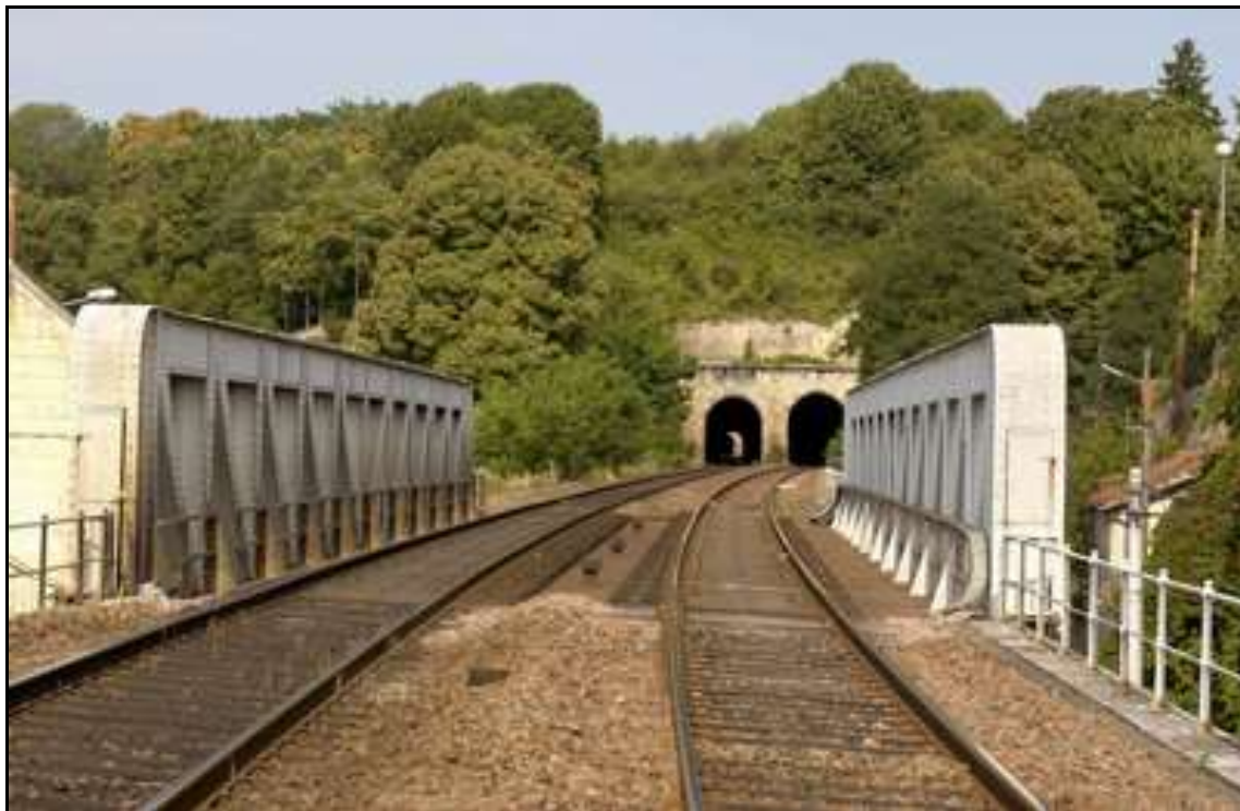
Les sorties des deux tunnels de Montrichard 1 A gauche, le tunnel Sud ; et à droite, le tunnel Nord