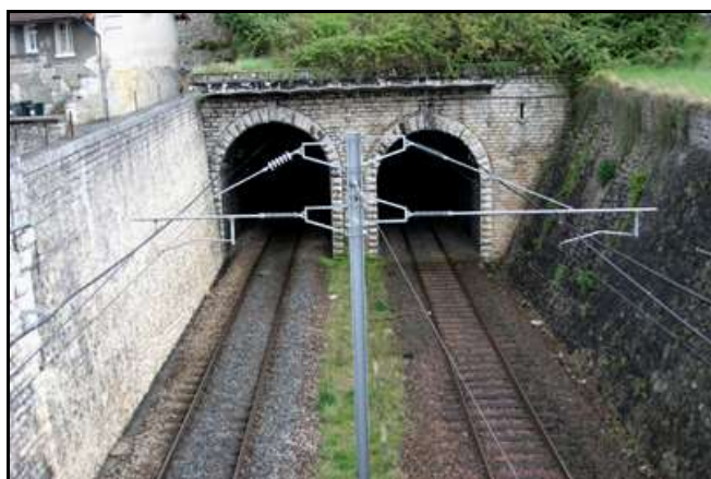
Le tunnel de Montrichard Nord 1 est ici à gauche