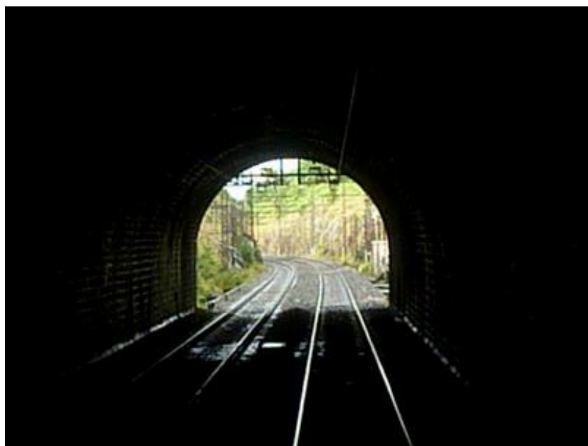
La sortie vue de l'intérieur

Si cette fiche comporte des erreurs ou des oublis, merci de nous le signaler.