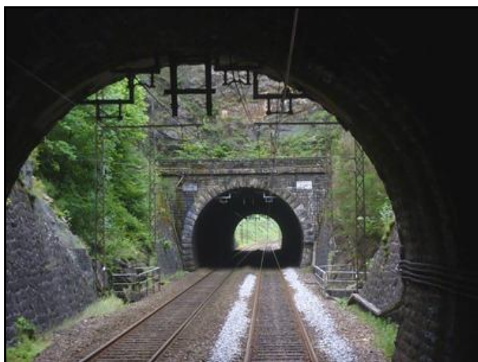
L'entrée du tunnel vue depuis la sortie de Theil n° 1