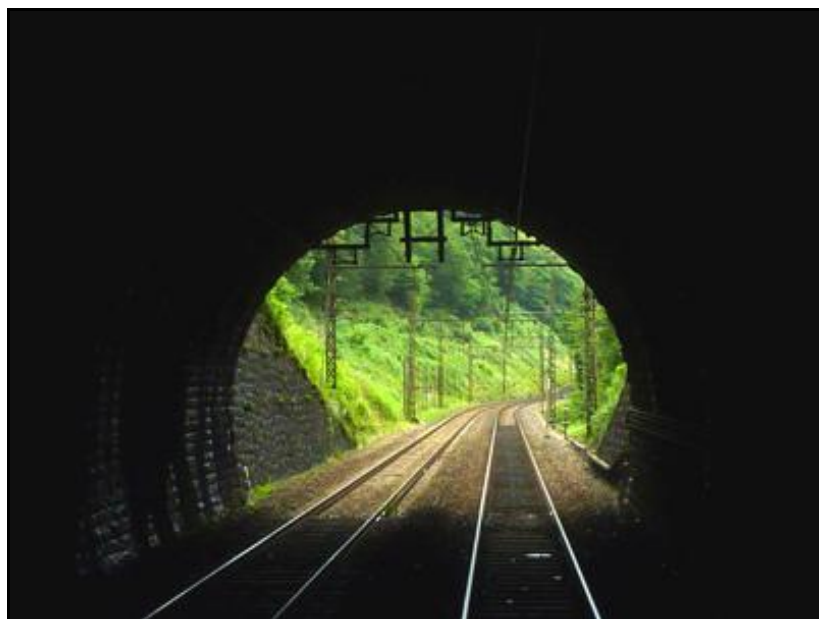
La sortie vue de l'intérieur

Si cette fiche comporte des erreurs ou des oublis, merci de nous le signaler.