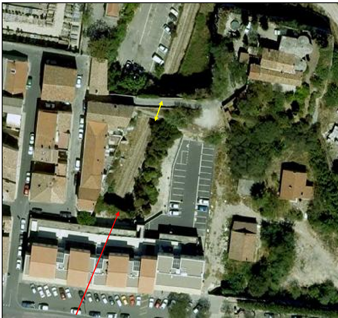
Les tunnels de la Croisière Flèche jaune : vrai tunnel de la Croisière 1 Flèche rouge : faux tunnel de la Croisière 2

Si cette fiche comporte des erreurs ou des oublis, merci de nous le signaler.