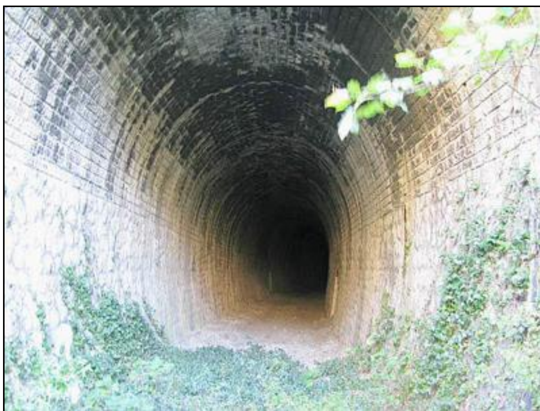
La belle galerie du tunnel

Si cette fiche comporte des erreurs ou des oublis, merci de nous le signaler.