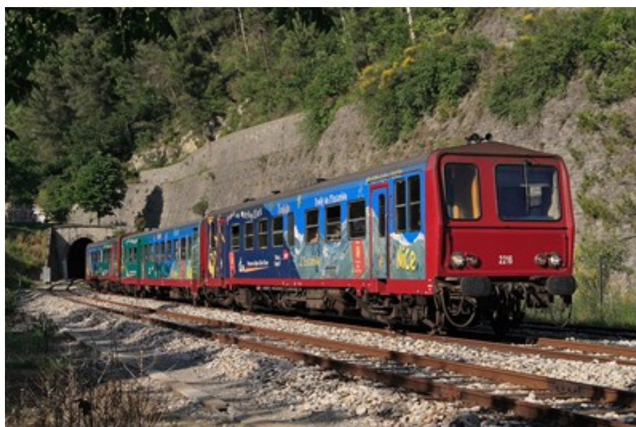
Dates des photos inconnues